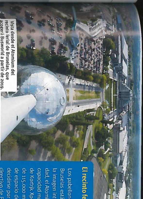
Vista desde el Atomium del recinto ferial de Bruselas, que acogerá Busworld a partir de 2019.

Centrándonos ya en la presente edición, Busworld ha reunido a 350 compañías expositoras procedentes de 33 naciones diferentes, lo que supone un incremento de ocho firmas y de un país más que en la an-