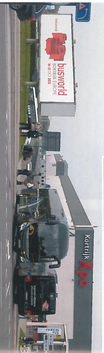
Vista exterior de las instalaciones de Kortrijk Xpo.

européo presentado en el mercado en los últimos dos años. En esta ocasión, se entrega el Coach of the Year 2018 al modelo ganador de las pruebas Coach Euro Test, que este año ha tenido lugar en Lingköping (Suecia) y al que optan el i8 de Irizar, el Evadys de Iveco, el nuevo Touring de Mercedes-Benz, el Tourliner de Neoplan, el Interlink HD de Scania y el doble piso Futura FDD2-141 del fabricante VDL.