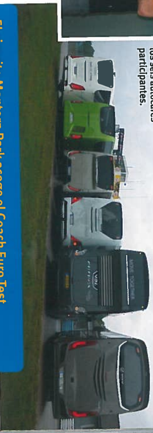
Las traseras de los seis autocares participantes.