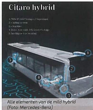
Alle elementen van de mild hybrid