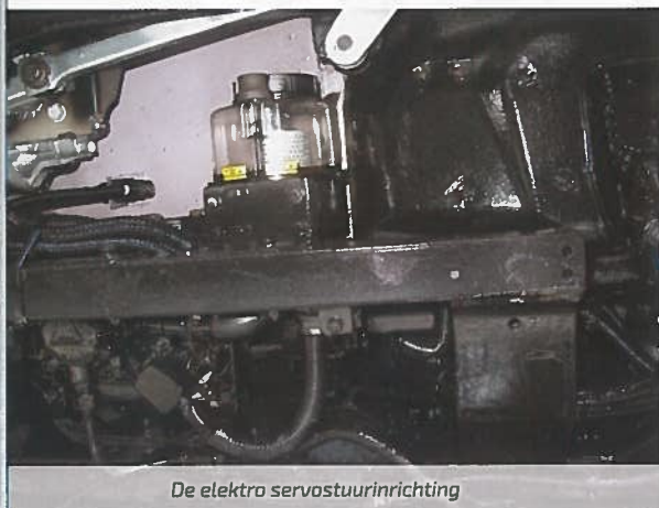
De elektro servostuurinrichting