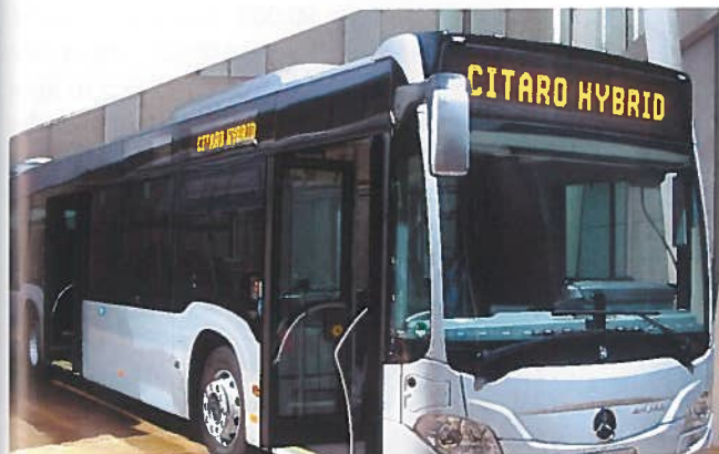
Citaro Mild Hybrid