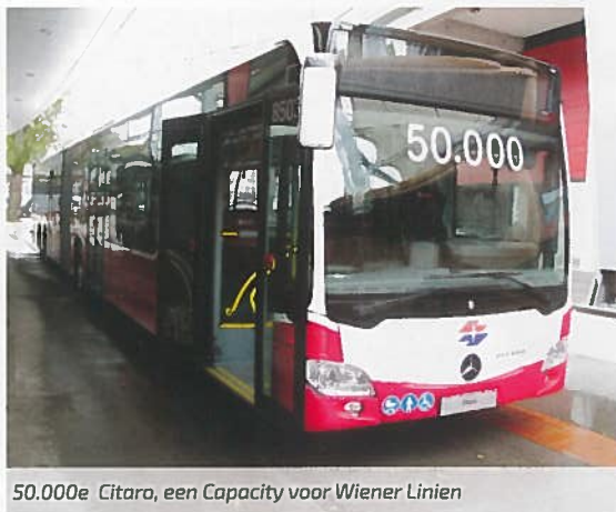
50.000e Citaro, een Capacity voor Wiener Linien

stadsbussen voor Recife en 60 Citaro's voor Wroclaw. Het verkoopoffensief in de opkomende markten in Afrika en Azië begint vruchten af te werpen. Vier van de tien langeafstandsbus- sen in Europa zijn van 'Das Haus' afkomstig en men verwacht dat deze in 2017 gezamen- lijk 40 miljoen reizigers zullen vervoeren. Wie verwacht had dat Mercedes-Benz informatie zou verstrekken over eventueel in ontwikkeling zijnde packs om Euro V en EEV bussen minder