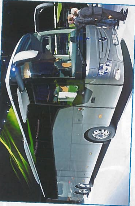
Le Mercedes Tourismo RHD adopte dorénavant des lignes plus fluides, de nouveaux feux, des équipements multiples et propose 2 aménagements de tableau de bord.

Début juillet, cette fois, à Stuttgart, Setra a levé le voile sur son nouveau car double étage S 531 DT TopClass. Le remplaçant