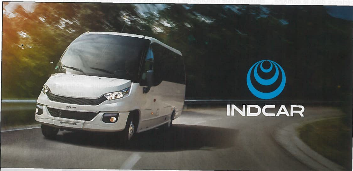
Strada 9-22 pl Iveco Daily Mercedes Sprinter