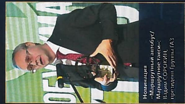
Номинация «Маршрутный автобус/Маршрутное такси»: Вадим СОРОКИН, президент Группы ГАЗ