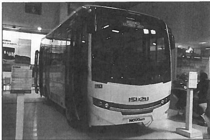
Ci-dessus, l'Isuzu Bus Nocociti et ci-dessous les Citiport et Citibus pour l'activité urbaine.