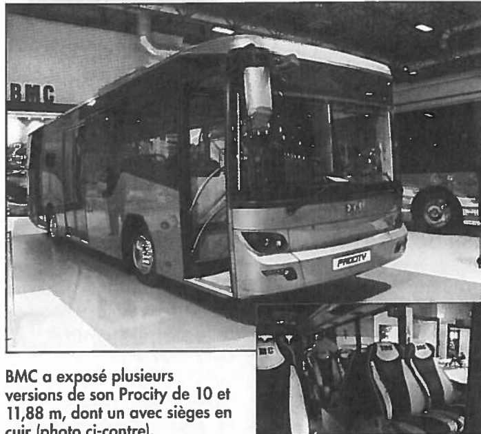
BMC a exposé plusieurs versions de son Procity de 10 et 11,88 m, dont un avec sièges en cuir (photo ci-contre).

La marque mythique British motor company (camions, cars, véhicules militaires) qui appartenait à la holding turque Çukurova en 1989 est aujourd'hui à nouveau en activité après un ar-