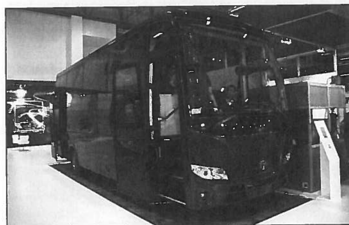
L'Opalin de Temsa, dévoilé à Busworld Turquie, fait 7,74 m de long et a une capacité maxi de 33 passagers + conducteur.

On le croyait définitivement rayé du catalogue du constructeur, mais non..