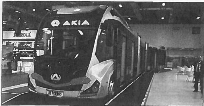
Akia a dévoilé son Métrobus de 25 m. Il existe une version diesel (équipée du moteur Mercedes 10,7 l), hybride et trolleybus

rêt en 2013 pour raisons financières... Présent au salon Busworld Turquie, le constructeur, repris depuis par un groupe financier, a exposé plusieurs versions de son Procity (péri-urbain, interurbain). Il n'a plus d'importateur en France depuis trois ans mais dit reprendre contact avec des experts du car et du bus en Europe.