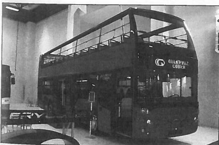
Le double étage de Güteryüz est doté du moteur Mercedes de 7,7 l ou Man de 6,8 l développant 300 ou 290 ch respectivement.