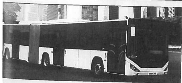
La capacité du Kent articulé est de 38 places assises et 170 debout.

Depuis sa nouvelle collaboration en France avec FCC, les projets avancent. Rappelons que l'importateur vendéen commercialise, pour l'urbain, hormis les bus Citiport et Citibus (9,51 m, 17 assis + 57 debout ou 30 debout + 1 UFR), le Novociti de 7,50 m en 16 places assises + 39 debout (ou 34 places debout + 1 place pour fauteuil roulant), pour l'interurbain le Turquoise (7,72 m 33 places assises + 1), le