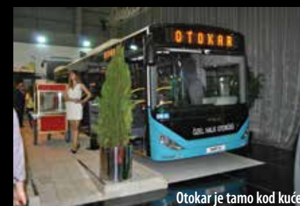
Otokar je tamo kod kuće

Kriza u svijetu autobusa postoji, sve je manja i manja, ali više nije tako izražajna kao u nekim ostalim segmentima gospodarstva. Broj proizvedenih i prodanih vozila u Turskoj to najbolje potkrepljuje, bilježe samo rast.