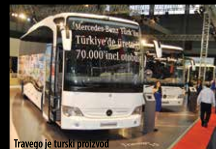
Travego je turski proizvod

je novi turski rekord. Stoga, s nestrpljenjem očekujemo sajamsku priredbu u Istanbulu i novitete koje ćemo nakon što ih vidimo na sajmu, i isprobati na cesti.