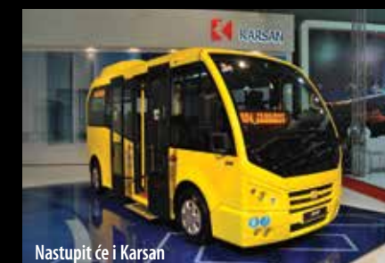
Nastupit će i Karsan

europske scene tu je bila Setra s glamurom nove serije 500, ali izdvajamo i nastupe proizvođača iz Kine, Irana i Uzbekistana.