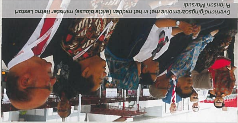
Overhandigingsscenerie met in het midden (witte blouse) minister Retno Lestari Priansari Marsudi