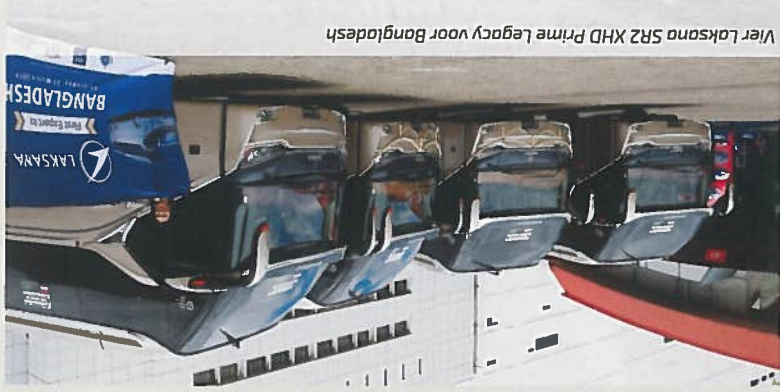
Vier Laksana SR2 XHD Prime Legacy voor Bangladesh

Voor het eerst in zijn geschiedenis landde Busworld