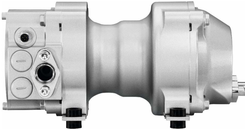
Afbeelding 1: Perfect voor onderweg: SPEEDLITE-compressoren (hier: ELV21) zijn stil, trillingsarm en ruimtebesparend