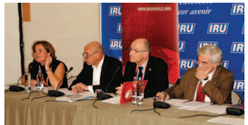
Die Organisatoren der Busworld erwarten 2009 eine erfolgreiche Ausstellung.

chinesische Busindustrie unterdessen auch ihren festen Platz bei der Busworld-Ausstellung in Kortrijk gefunden. Sage und schreibe vier chinesische Bushersteller sind vertreten: King Long, Yutong, Ankaï und Golden Dragon. Zentrales Thema dieser Ausstellung ist die Umwelt. Alternativen Brennstoffen und Antriebssystemen wird sehr großes Interesse zuteil. So ist bei dieser Ausstellung der erste Bus mit Brennstoffzellen als Antriebssystem zu sehen. Somit unterstreicht die Busworld Ausstellung ihre Position als weltweite Plattform für die Personenbeförderung per Bus. Die Busworld ist bei der Erkennung von Engpässen und dem Angebot von Lösungen mit dem Finger am Puls der Zeit.