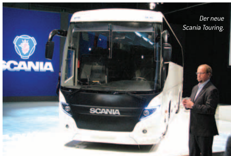
Der neue Scania Touring.

Mit der Weltpremiere des Touring führt Scania eine völlig neue, umfassende Reisebusserie ein. Der Scania Touring wurde vom Designteam im schwedischen Södertälje entworfen und von Higer aus China gebaut. Der 12 Meter lange Scania Touring mit 13 Liter 400 PS Euro 5-EGR-Motor und Opticruise-Schaltsystem wird als umfassender Scania-Reisebus im Markt positioniert und beworben.